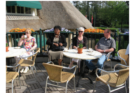
“Lekker erop uit!”

Heb je andere kwaliteiten en wil je die graag inzetten, dan zoeken wij samen met je naar de mogelijkheden. Winst voor twee is wat we beogen. Ook vanuit maatschappelijk betrokken ondernemen of studie is het mogelijk om je vrijwillig in te zetten.